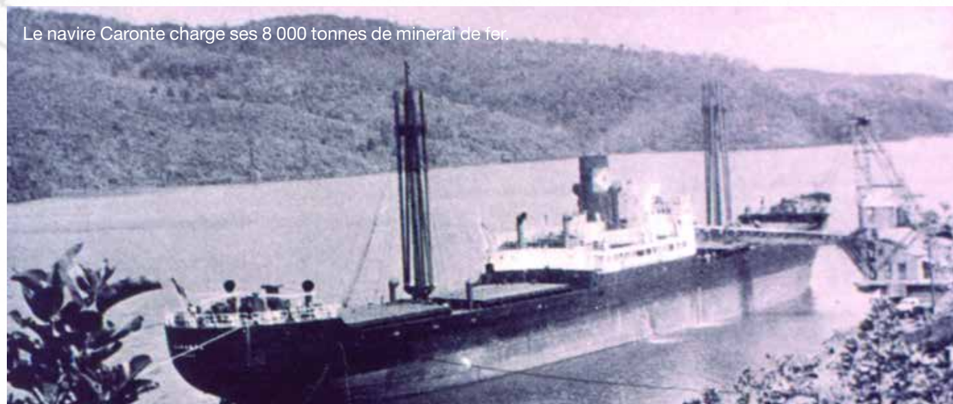
Le navire Caronte charge ses 8 000 tonnes de minerai de fer.

Dès 1880, le quartier mondorien du Grand Sud a été le théâtre d'une activité minière intense qui se perpétue plus que jamais en ce second millénaire. Découvrez l'histoire de la prospection et de l'exploitation du nickel, mais aussi et avant tout du cobalt, du chrome et du fer, dans la baie du Prony.