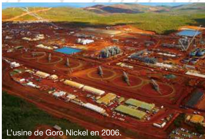
L'usine de Goro Nickel en 2006.

Dans les années 1960, le BRGM (Bureau de recherches géologiques minières) et la société canadienne INCO (International Nickel) entreprennent une prospection du Grand Sud sur plusieurs milliers d'hectares. Les sondages effectués révèlent l'une des plus importantes réserves mondiales de nickel. À la fin du 20 e siècle, ce gisement de saprolite, surnommé le « Diamant de Goro », est vendu à INCO. Par le biais de sa filiale Goro Nickel, une usine de traitement du minerai par un procédé hydro-métallurgique va ainsi voir le jour, début 2000, à l'est de la baie du Prony. La production de nickel et de cobalt démarre en 2008 pour atteindre sa pleine puissance en 2013. L'histoire ne fait que commencer.