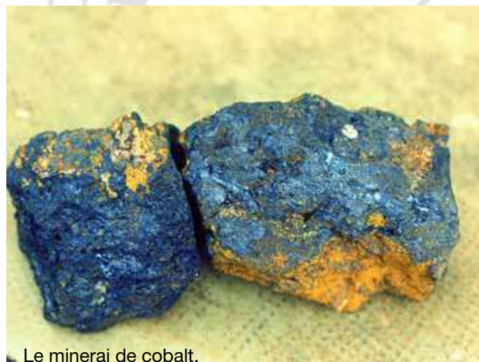
Le minerai de cobalt.

L'arc du relief environnant la baie du Prony a suscité, très tôt, la convoitise des exploitants miniers. En 1876, du minerai de cobalt y est découvert et une première concession est accordée le 2 août 1880 pour une mine baptisée Estampe. Son minerai est traité dans les Hauts Fourneaux de la pointe Chaleix, première usine de fusion pour la garniérite, le minerai de nickel. Jusqu'en 1905, la Nouvelle-Calédonie restera le seul producteur mondial de cobalt !