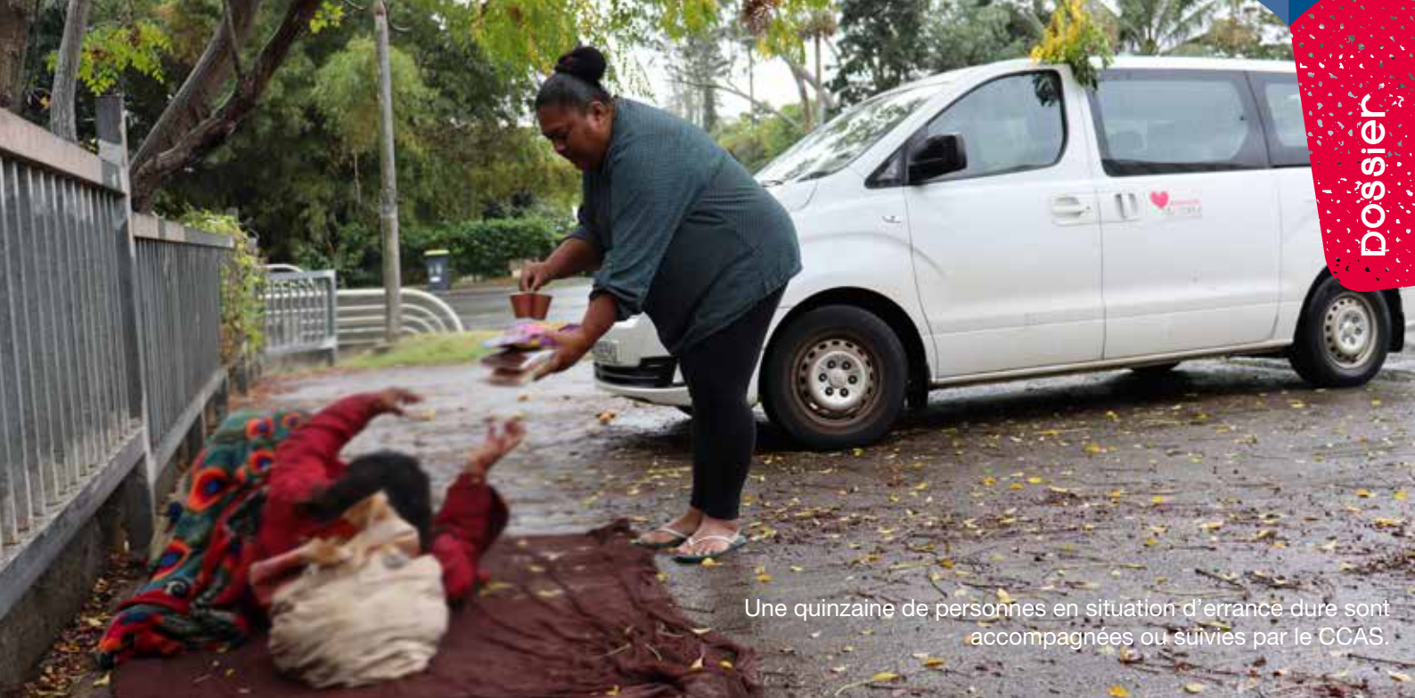
Une quinzaine de personnes en situation d'errance dure sont accompagnées ou suivies par le CCAS.