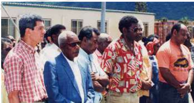
Cérémonie de coutume lors de l'inauguration de l'usine pilote.